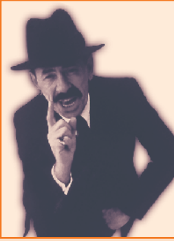
John Larkin alias Scatman John